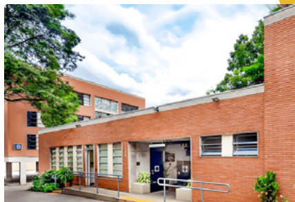
Campus São Paulo Rua Pedro de Toledo, 1071 - Vila Mariana