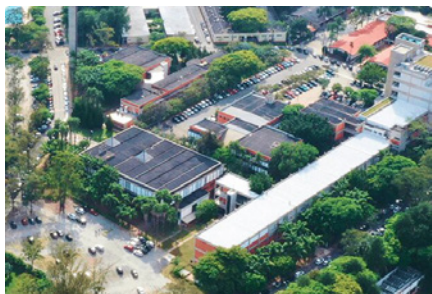
Campus São Caetano do Sul Praça Mauá, 01 - São Caetano do Sul

www.maua.br/a-maua/assessoria-de-relacoes-internacionais